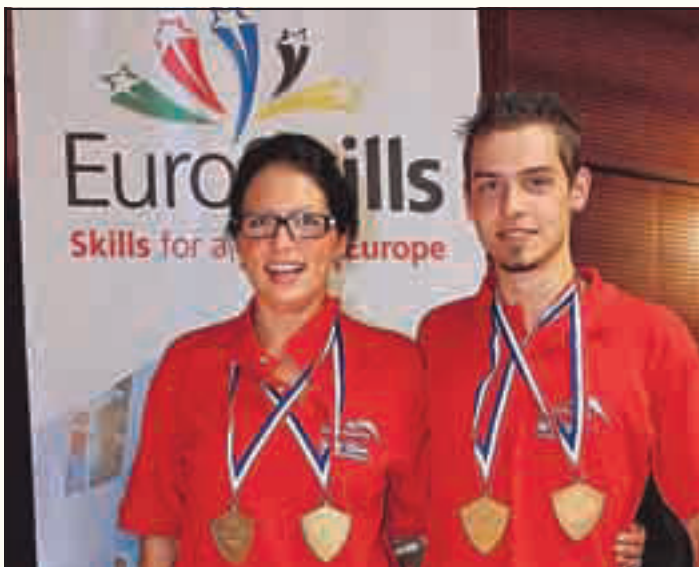
Einzel- und Mannschaftswertung: „Gold“ für Österreich!

Die Wirtschaftskammer Österreich verlost unter den Teilnehmern des Schnupperlehre-Fotowettbewerbes eine schnittige Vespa und neun iPods (Gewinner werden schriftlich verständigt). Informationen im Internet: www.schnupperlehre.at