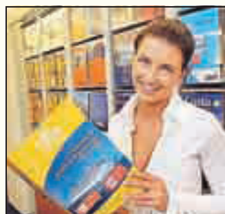
Schnuppern im Reisebüro

Das Angebot gilt auch für die Lehrberufe Koch/Köchin, Restaurantfachmann/-frau, Systemgastro- nom und Fitnessbetreuer/in. Im Tourismus sind in ganz Österreich 1600 Lehrstellen frei! Alle teilnehmenden Betriebe und Infos im Internet unter: www.schnupperlehre.at