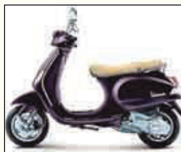
Eine Vespa als Hauptpreis

Wer teilnimmt, macht damit aber nicht nur aktiv etwas für die zukünftige Karriere, es gibt auch noch tolle Preise zu gewinnen: Die Wirtschaftskammer verlost unter allen Teilnehmern neun i-Pods und eine flotte Vespa. (Die zehn Gewinner werden schriftlich verständigt.) Alle Infos zum Gewinnspiel sowie zu den 300 teilnehmenden Betrieben unter www.schnupperlehre.at